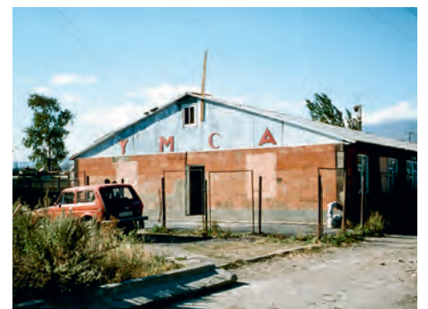
Altes Gebäude des YMCA Spitak